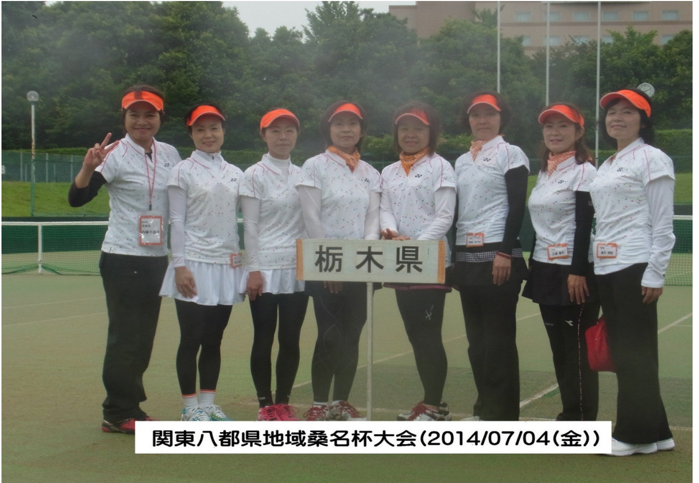
関東八都県地域桑名杯大会(2014/07/04(金))