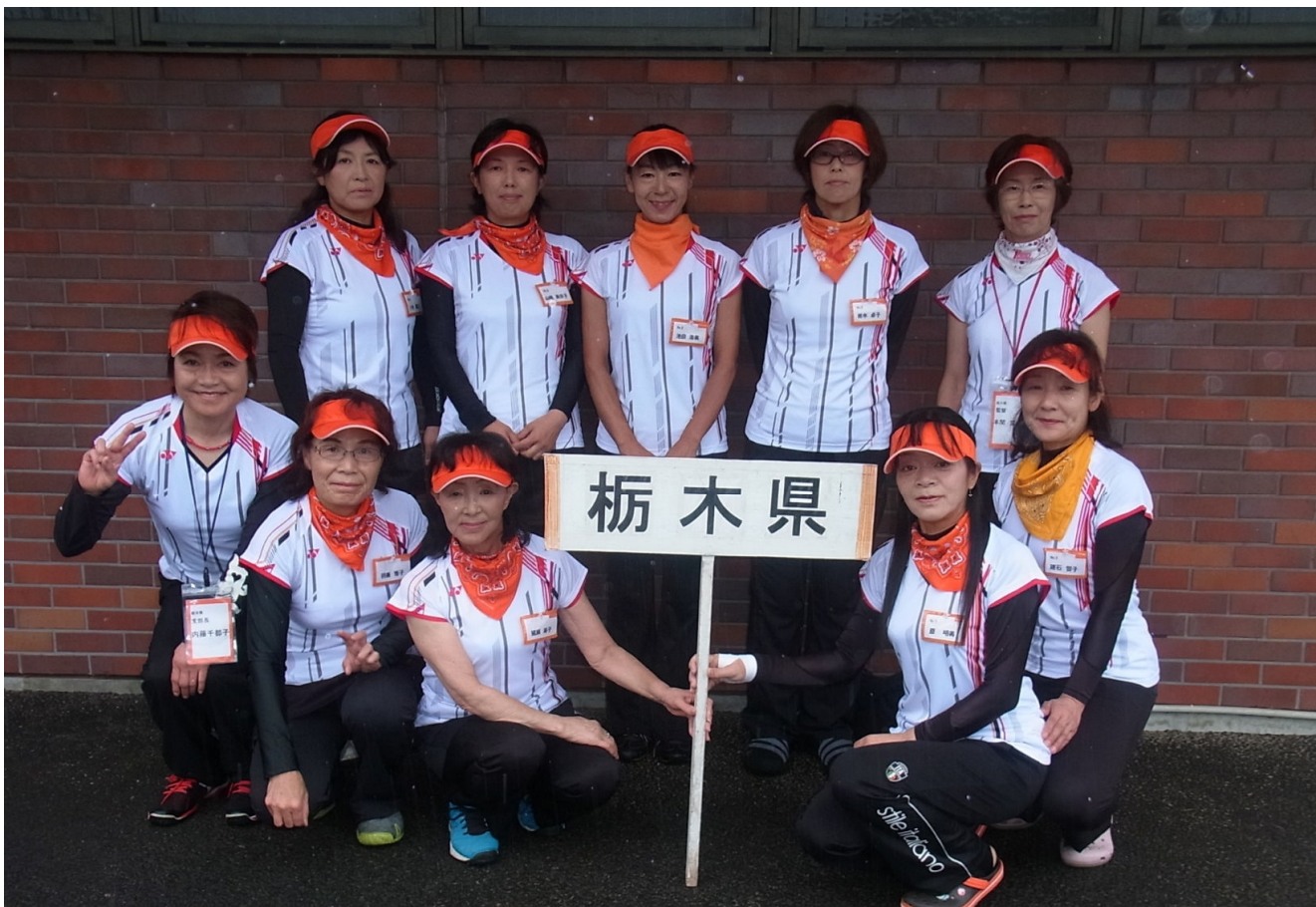
第22回関東八都県地域桑名杯(一般・60歳以上の部)大会 2015年07月03日