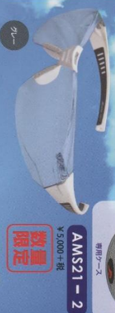
AMS21 - 2 ¥5,000+税 専用ケース