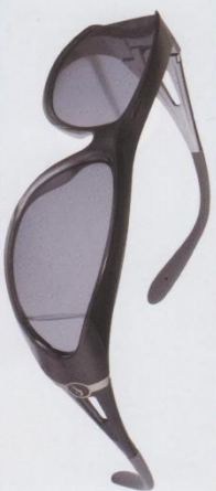
SG - 604P ¥8,000+税 レンズカラー：スモーク