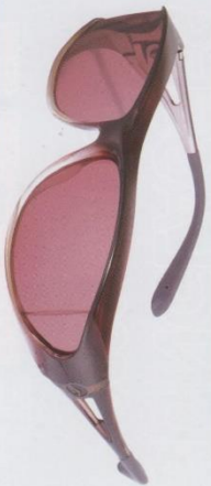
SG - 604P ¥8,000+税 レンズカラー：ローズ