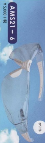
AMS21 - 6 ¥5,000+税

株式会社 アムスコポリューション 〒333-0802 埼玉県川口市戸塚東3-32-6 TEL (048) 298-2263 FAX (048) 298-2273 E-mail: ams_corp@nta.biglobe.ne.jp