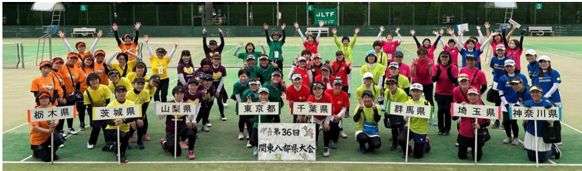
第36回関東八都県大会(一般) 埼玉県大会